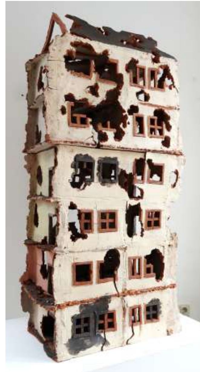
Rachel Kohn 'was bleibt' Steinzeug 115x37x52cm 2026

Schulklassen gern auch nach Vereinbarung unter post@freunde-kunsthalle-brennabor.com oder 0176 34644560