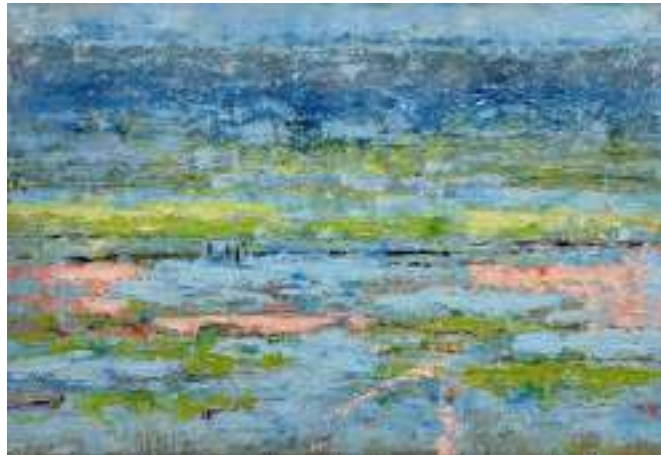
Annette Selle 'Musikalische Landschaft 2' 90x130cm Öl auf Leinwand