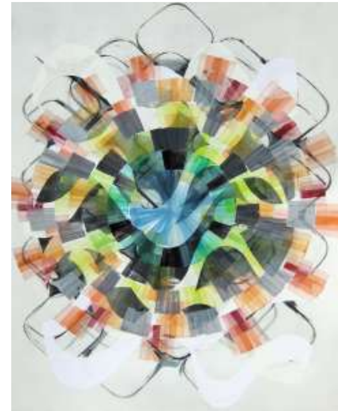
Ina Geißler 'eins zum anderen' übermalte Farbradierung 60x50cm