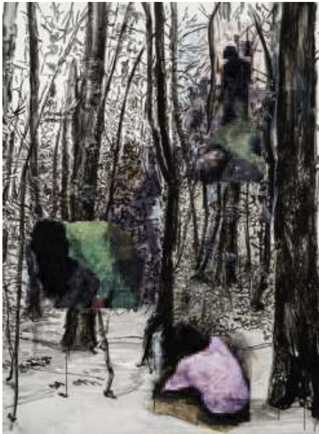
Sibylla Weisweiler 'Wald' 190x145 cm Acryl auf Leinwand